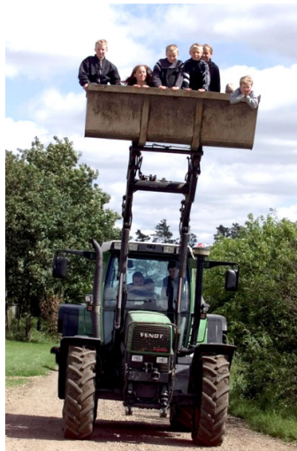
Der er sjovt ude på landet – men også lidt farligt.